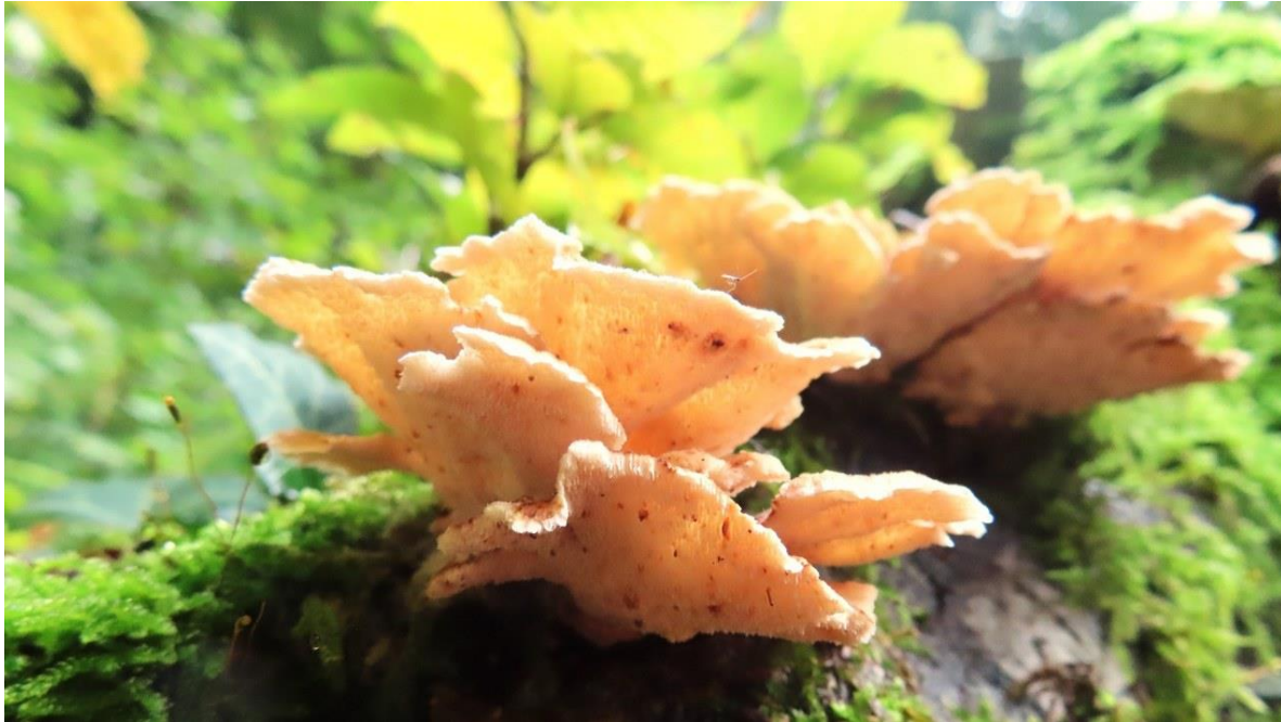
Gezoned elfenbankje in de herfstzon

Omdat wij iedereen willen laten genieten van de natuur.