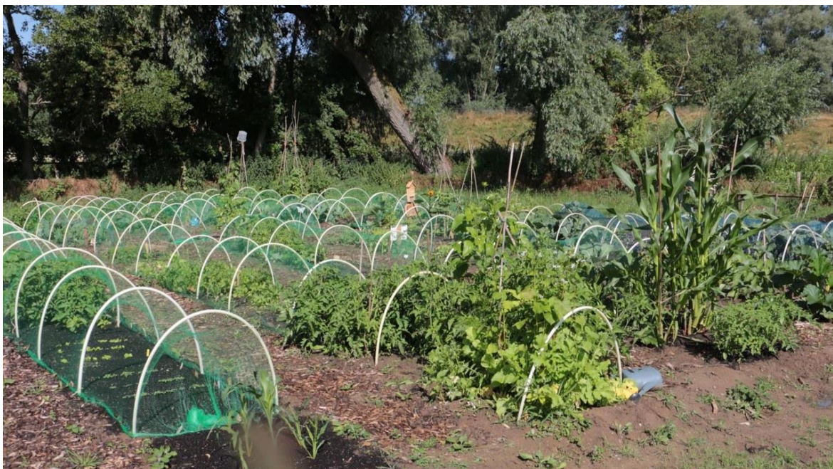
Alles groeide geweldig in de moestuintjes voor kinderen in Huissen

Het tuinseizoen was eigenlijk al begonnen toen de tuintjes ter beschikking kwamen voor de jonge tuinders, maar dat heeft het succes niet in de weg gestaan. Uiteindelijk zijn 11 tuintjes in gebruik genomen door 14 jonge tuinders. Dit is mogelijk gemaakt door 9 vrijwilligers: 3 begeleiders van de jonge tuinders en 6 voor het uitvoeren van de projecten.