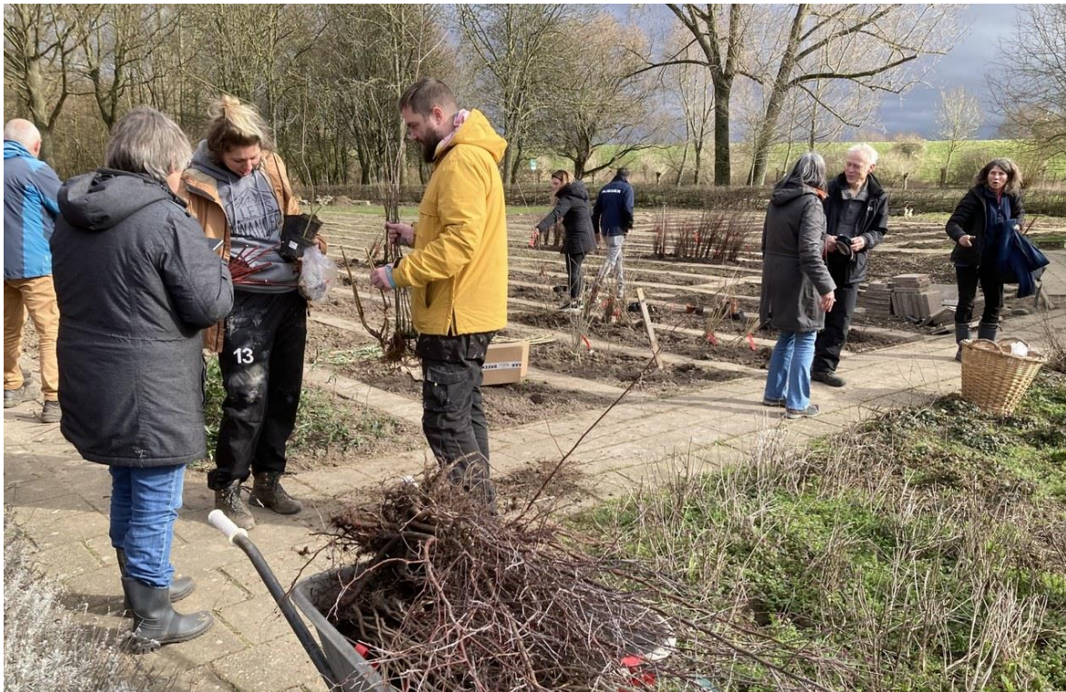
Breng- en haalmiddag van jonge boompjes bij de Veldschuur