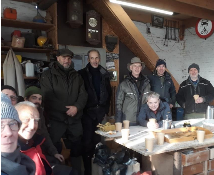
Koffiepauze tijdens vlechten op Landgoed Groot Holthuizen in Huissen

De brigade heeft op 6 zaterdagen gevlochten aan de heggen. Gemiddeld zijn er 5 tot 8 vlechters actief geweest met dit prachtige ambacht. In 2023 is in totaal zo'n 140 meter gevlochten. Er liggen nog de nodige meters te wachten om in het komende seizoen gevlochten te worden, zowel bij Fort Pannerden als op Landgoed Groot Holthuizen.