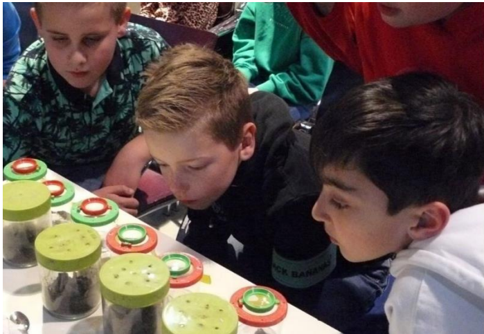
Een lesje over de diertjes in de schoolmoestuintjes

Op het terrein van de Veldschuur waren ook in 2023 weer veel tuinvakken van elk 4 m 2 klaargemaakt voor kinderen van basisscholen uit Bemmelen. In totaal hebben 111 kinderen, veelal uit groep 5/6, een eigen tuintje beheerd. Het betrof leerlingen van De Vlinderboom (30 leerlingen), Pius X (18), de Regenboog (23), Donatushof (34) en tot slot 6 individuele kinderen (contracttuintjes). Het aantal kinderen is licht dalend door minder kinderen bij alle scholen. Ongeveer 25 vrijwilligers zorgden ervoor, dat de kinderen spelenderwijs veel leerden over “het hoe en wat” van een moestuintje.