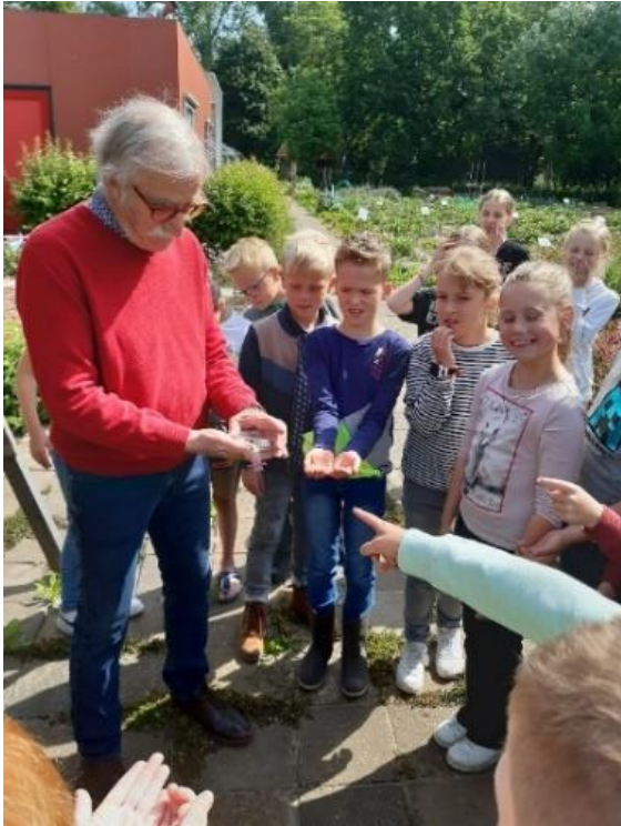
Gelukkig, solitaire bijen steken niet!

In november werden de cocons geoogst. De kwaliteit van de cocons was ook dit jaar prima, het soortelijk gewicht en het aantal cocons vertoonde een nagenoeg gelijke tred met het resultaat van voorgaande jaren.