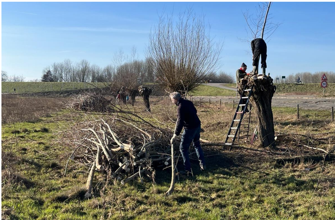
Knotten van wilgen