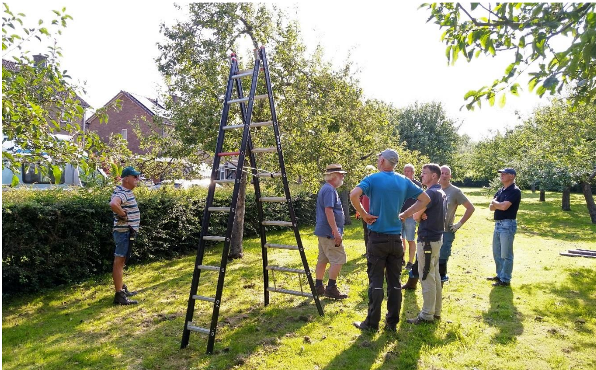
Eerst uitleg over wat er gedaan moet worden.

Deze vrijwilligersgroep snoeit oude appel-, peren- en pruimenbomen waar doorgaans al jaren weinig aan beheer is gedaan. Voor de eigenaren wordt het onderhoud dan te veel en kan de verleiding groot worden om ze dan maar weg te halen. Om dat te voorkomen helpt de brigade om het achterstallig onderhoud weg te werken zodat ze er weer jaren tegen kunnen. Vaak zijn het namelijk restanten van geëxploiteerde boomgaarden die economisch inmiddels geen waarde meer hebben. Gelukkig zijn er in de gemeente nog veel boomgaarden aanwezig die door de eigenaren worden gekoesterd. Met een kleine ploeg vrijwilligers werden de handen uit de mouwen gestoken. Het materiaal kon geleend worden van Landschapsbeheer Gelderland. Net als de andere groepen, is de hoogstambrigade vooral in weekenden in de winter actief, maar er werd zo nodig ook op werkdagen gewerkt en 's zomers voor de zomersnoei (waterlot) en de snoei van pruimenbomen, na de oogst.