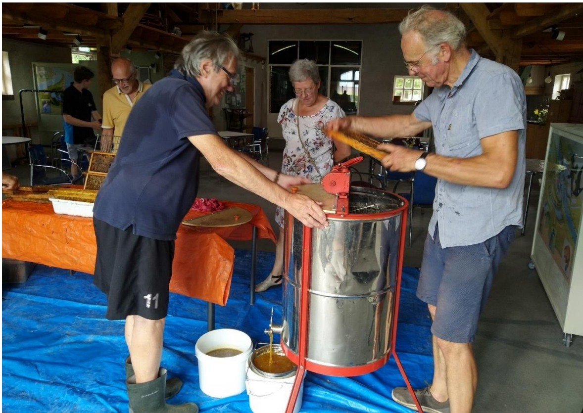
De raat gaat in de slingerton.

De imker verzorgde niet alleen de bijen maar gaf ook uitleg over honingbijen aan de kinderen tijdens NME-lessen en aan de kinderen van de moestuintjes. De kinderen zijn altijd blij verrast als ze de bijen in en uit de kast kunnen zien vliegen. Ruim een meter vóór de kasten is in 2023 een scherm met ramen geplaatst, waardoor de kinderen de bijen beter kunnen zien zonder het risico een bijensteek te lopen. Het plan is om in 2024 een observatiekast op de bijenstal te monteren. Een van de wanden van de kast is daarbij van plexiglas, zodat je de bijen ook echt in de kast bezig kunt zien. Dat moet dan wel op een niet te zonnige plek, om te voorkomen dat het te warm wordt in de kast.