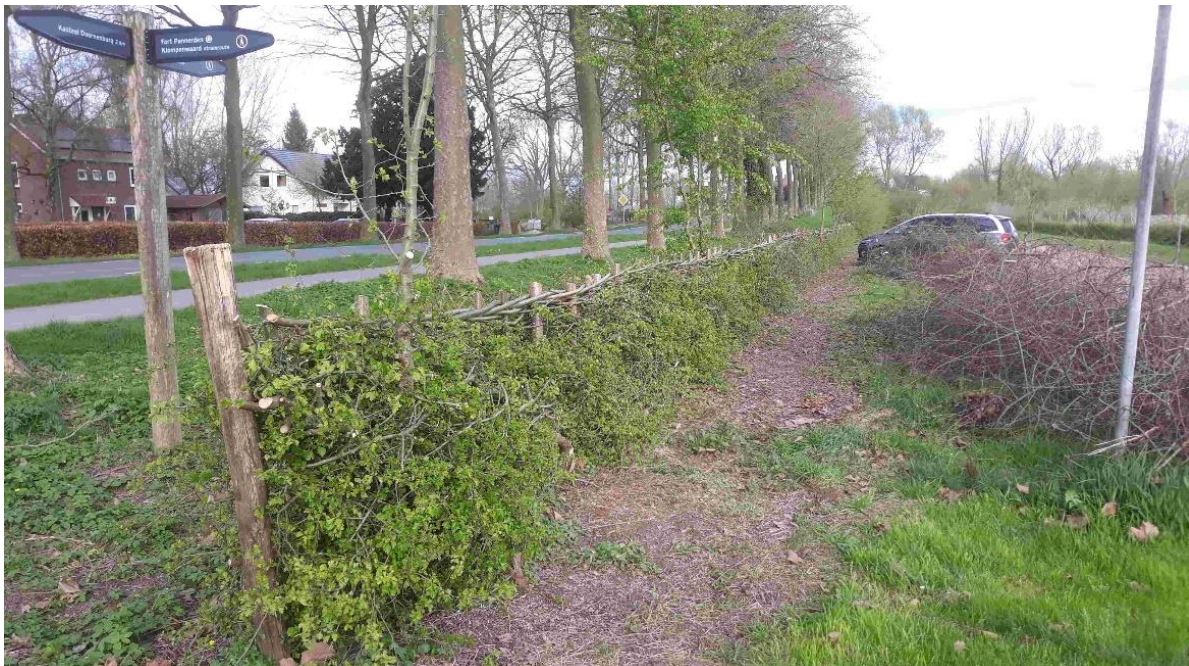
Vlechtwerk rond de parkeerplaats van Fort Pannerden aan de Pannerdense weg.

Ook in 2023 is de heggenvlechtbrigade op meerdere zaterdagen actief geweest. Allereerst werd verdergegaan met het vlechten van de meidoornhaag rondom de parkeerplaats van Fort Pannerden aan de Pannerdenseweg in Doornenburg. Er is toch weer circa 40 meter gevlochten en er werd een begin gemaakt met de heg aan de voorzijde van de parkeerplaats. Inmiddels is de heg fors uitgegroeid en is er een volle asymmetrische heg met veel natuurwaarde ontstaan waar de runderen (rode Geuzen) aan de achterzijde ook profijt van hebben door eraan te knabbelen.