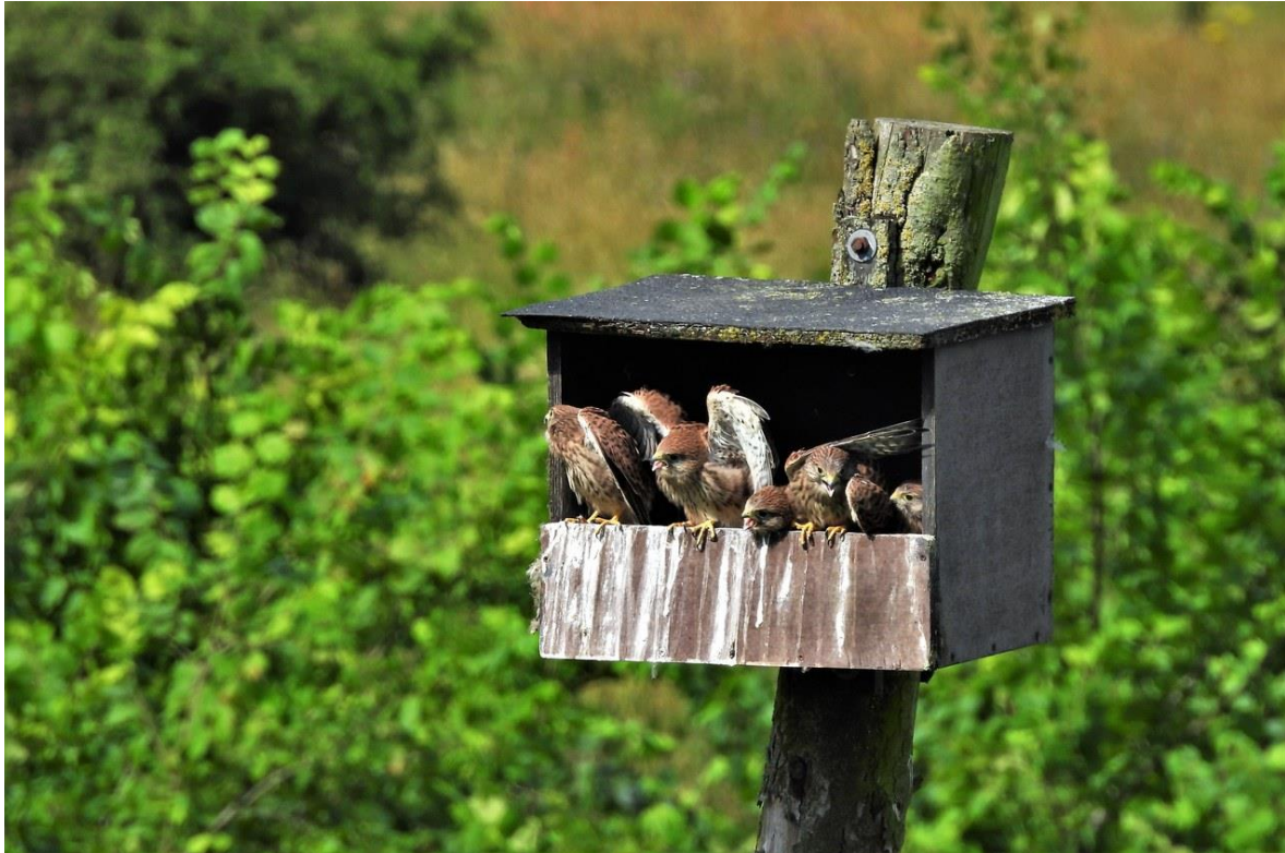
Torenvalkjes in de nestkast aan de dijk bij Hulhuizen staan op het punt om uit te vliegen

Omdat wij betere voorwaarden willen creëren voor kwetsbare flora en fauna in Lingewaard.